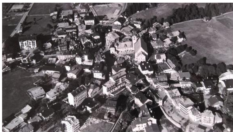
Megève en 1950

L'Association suivra, bien sûr, ces travaux, et nous sommes pleinement mobilisés pour contribuer à la réussite le plus rapidement possible de ces opérations.