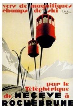
80 ans du téléphérique de Rochebrune