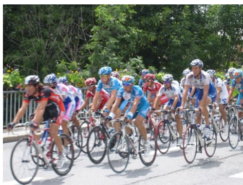
Tour de France (passage à Megève en 2010)